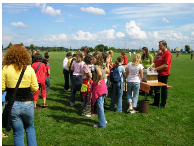
Abholung der Zertifikate auf der Abschlussparty

Zusätzlicher Anreiz war erneut eine Tombola, bei der es attraktive Preise zu gewinnen gab.