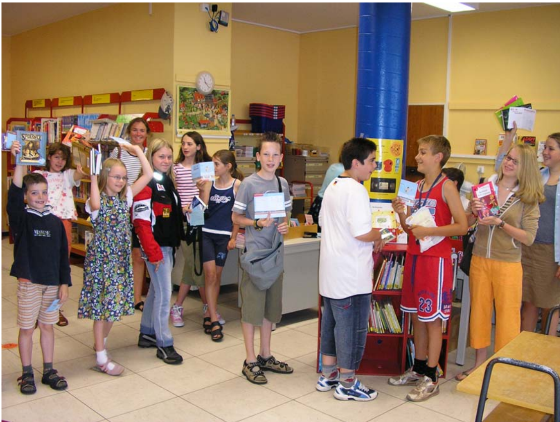
ein alltäglicher Anblick in den Sommerferien...