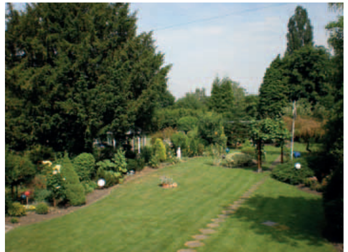
Fotos: oben: Der Halbstarke Günter; unten: links Bei der Parkpflege; rechts So weit das Auge reicht: Der Radtke-Park