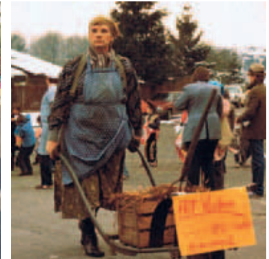
Fotos von links: Unterwegs im Vochemer Karneval, Schönes Paar mit Ziege, Alt-Vochem ... es war einmal