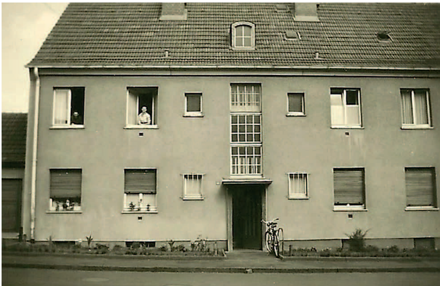
Foto: Zum Herrengarten 46