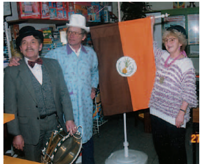
Fotos: oben: links Das Dreigestirn zu Besuch; unten: links Marketingmaßnahme; rechts Jubiläum Alaaf