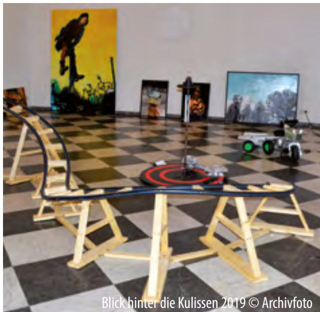
Blick hinter die Kulissen 2019

Werfen Sie in der Galerie am Schloss, Schlossstraße 25, und im Kapitelsaal des historischen Rathauses, Uhlstraße 3, 50321 Brühl, am Sa/So, 18./19. Januar 2020, 11-17 Uhr , einen