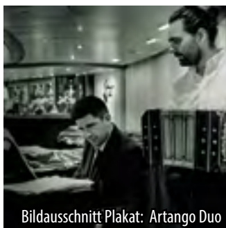
Bildausschnitt Plakat: Artango Duo