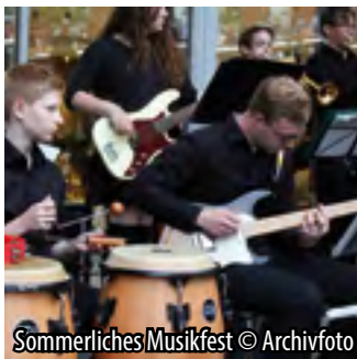
Sommerliches Musikfest