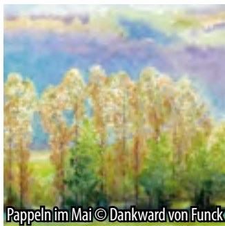
Pappeln im Mai © Dankward von Funk

Neben dem ständigen Kursangebot an der Kunst- und Musikschule der Stadt Brühl werden regelmäßig Workshops angeboten.