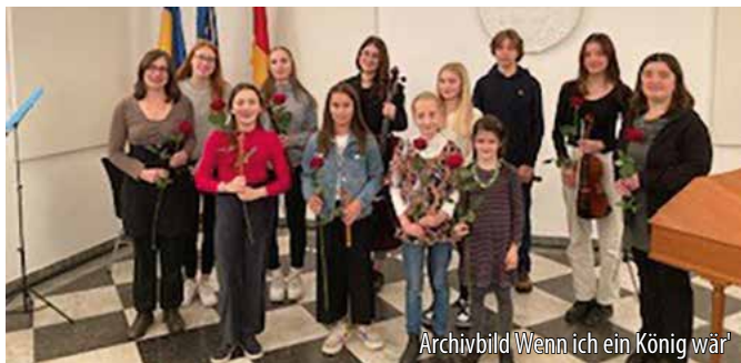
Archivbild Wenn ich ein König wär'