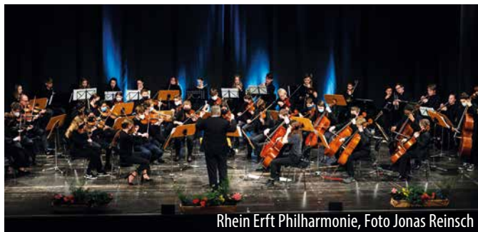
Rhein Erft Philharmonie, Foto Jonas Reinsch

Die JeKits-Chöre der Städtischen Katholischen Grundschulen Pingsdorf und St. Franziskus sowie der Chor für Kinder ab 7 Jahre der Kunst- und Musikschule der Stadt Brühl treten unter der Leitung von Christine Albert auf (Do., 07.09./17 h).