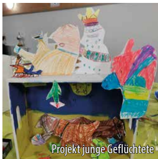
Projekt junge Geflüchtete