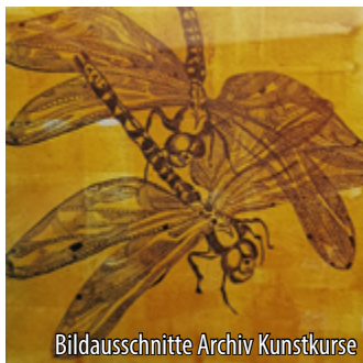
Bildausschnitte Archiv Kunstkurse