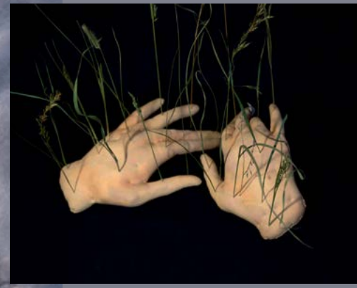
links: Die Max Ernst-Stipendiatin bei der Gestaltung eines Kunstwerks 2025; rechts: Einwachsene Hände, Objekt, Textil und Grashalme, 2024, Handgröße