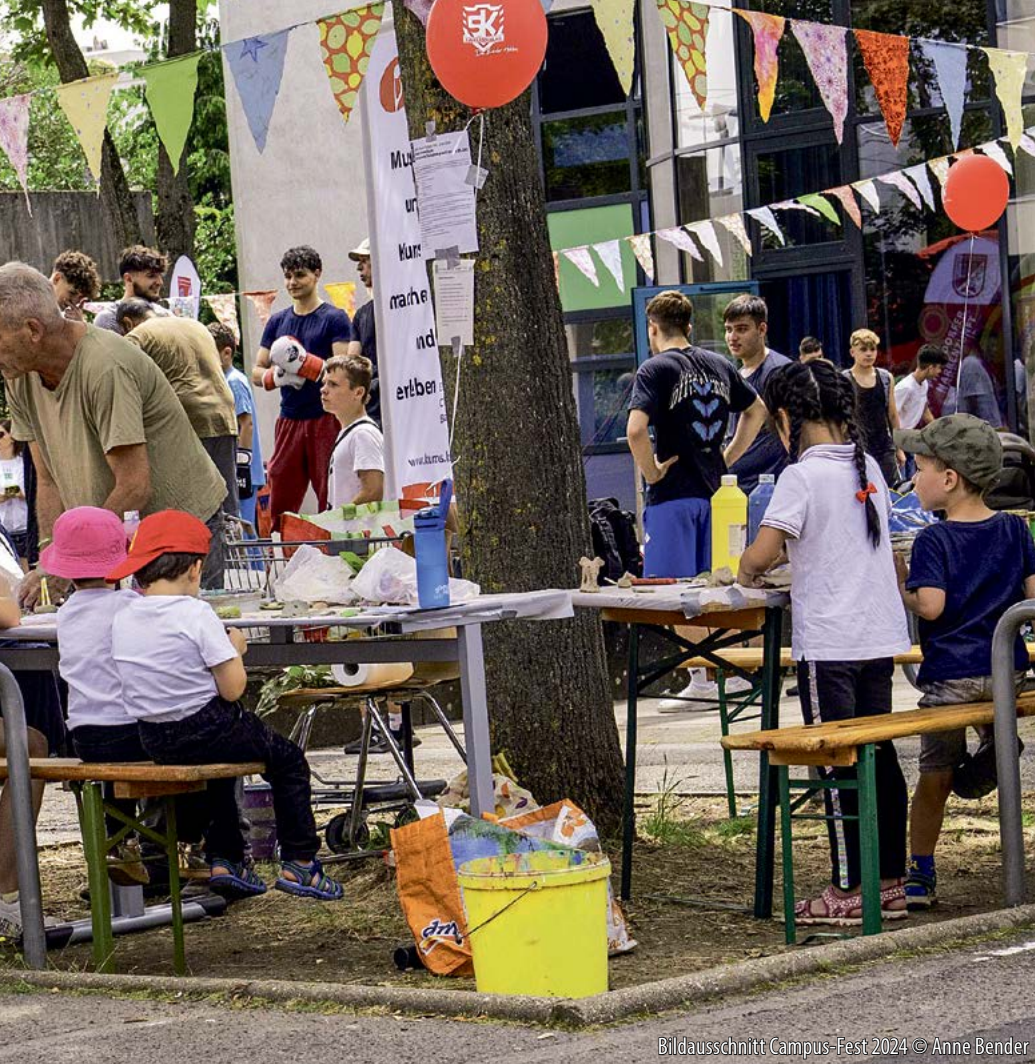
Bildausschnitt Campus-Fest 2024