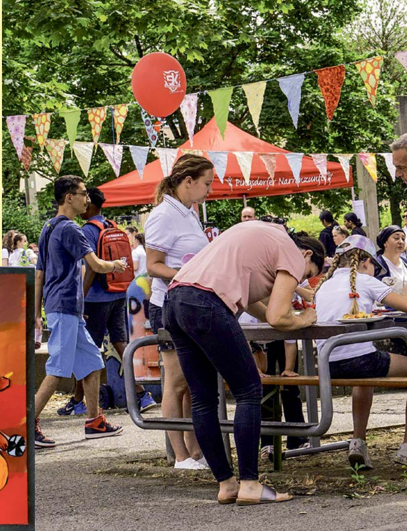
Aus den Kursen ©Kunst- und Musikschule Stadt Brühl