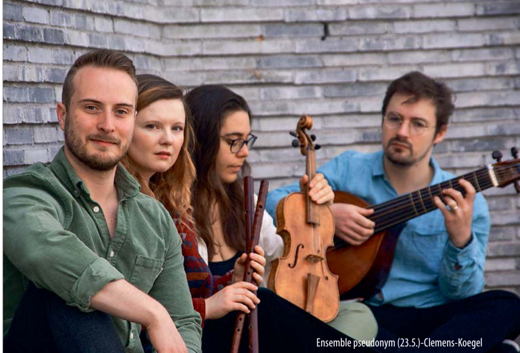
Ensemble pseudonym (23.5.)-Clemens-Koegel

📍 + Anmeldung: 02232 44000, mail@schlossbruehl.de , www.schlossbruehl.de